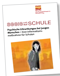
Broschüre „Seele trifft auf Schule“ Psychische Erkrankungen bei jungen Menschen – Eine Informationsmaßnahme für Schulen

2008 wurde die Broschüre „Seele trifft auf Schule“ Psychische Erkrankungen bei jungen Menschen – Eine Informationsmaßnahme für Schulen – erstellt und an SchülerInnen, PädagogInnen, Eltern, Schulpflegschaften, Lehrerverbände, Schulleiter, Gesundheitsfürsorge und die Öffentlichkeit in der Region Bonn und darüber hinaus verteilt.